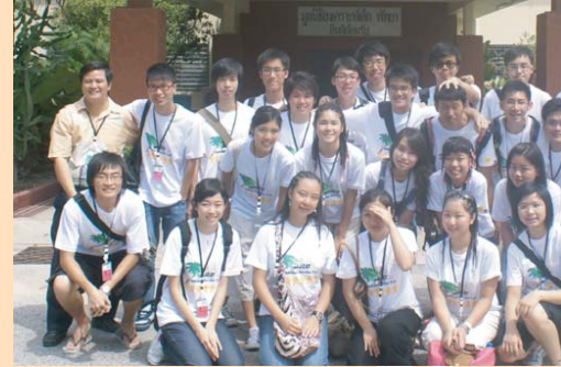
กระทรวงการพัฒนาสังคมและความมั่นคงของมนุษย์ ประเทศไทย ได้นำคณะเจ้าหน้าที่จากสาธารณรัฐประชาธิปไตยประชาชนลาว หลักสูตรสวัสดิการสังคมศึกษาดูงานด้านเด็กกำพร้า และ เด็กพิการทางการได้ยิน ณ มูลนิธิสงเคราะห์เด็ก พิทยา และโรงเรียนอนุบาลโสตพัฒนา