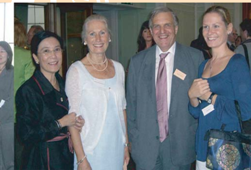
มูลนิธิ เอช เอช เอ็น เยอรมันนีเปิดสาขาในประเทศไทย ก่อตั้งขึ้นเพื่อรวบรวมและสนับสนุนเงินทุนสำหรับการศึกษาให้กับเด็กไทยโดยเฉพาะ