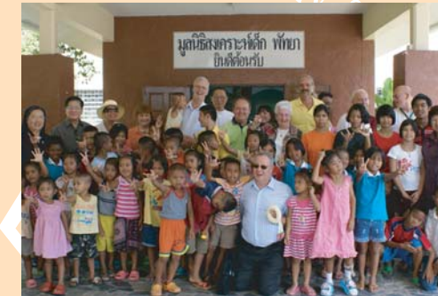
สโมสรโรตารีอินเตอร์เนชั่นแนล เยี่ยมเยียนกิจการของมูลนิธิฯ และโรงเรียนอนุบาลโสตฯ พร้อมทั้งเลี้ยงอาหารเที่ยงเด็กกำพร้า