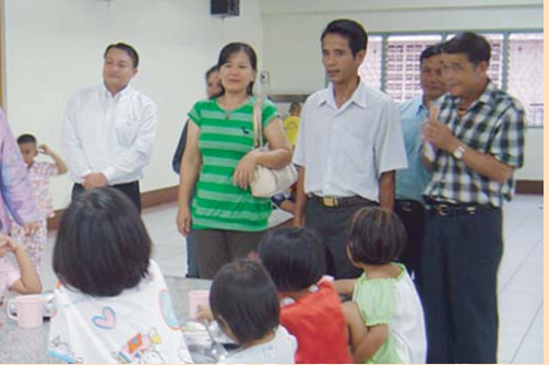
กระทรวงการพัฒนาสังคมและความมั่นคงของมนุษย์ ประเทศไทย ได้นำคณะเจ้าหน้าที่จากสาธารณรัฐประชาธิปไตยประชาชนลาว หลักสูตรสวัสดิการสังคมศึกษาดูงานด้านเด็กกำพร้า และ เด็กพิการทางการได้ยิน ณ มูลนิธิสงเคราะห์เด็ก พิทยา และโรงเรียนอนุบาลโสตพัฒนา