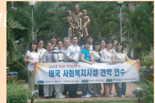
คณะเจ้าหน้าที่สภาที่ปรึกษาด้านสวัสดิการสังคมเมืองอินชอง ประเทศเกาหลี เข้าเยี่ยมชมกิจการศึกษางานมูลนิธิฯ และโรงเรียนอนุบาลโสตฯ