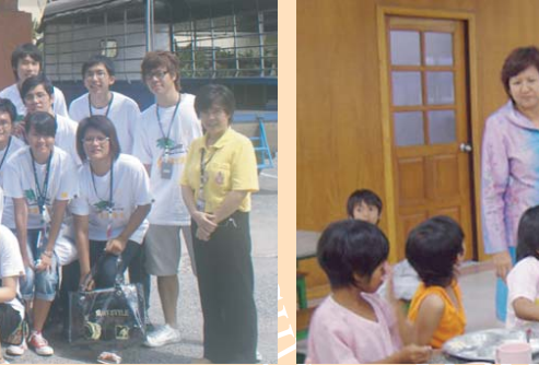
กระทรวงการพัฒนาสังคมและความมั่นคงของมนุษย์ ประเทศไทย ได้นำคณะเจ้าหน้าที่จากสาธารณรัฐประชาธิปไตยประชาชนลาว หลักสูตรสวัสดิการสังคมศึกษาดูงานด้านเด็กกำพร้า และ เด็กพิการทางการได้ยิน ณ มูลนิธิสงเคราะห์เด็ก พิทยา และโรงเรียนอนุบาลโสตพัฒนา