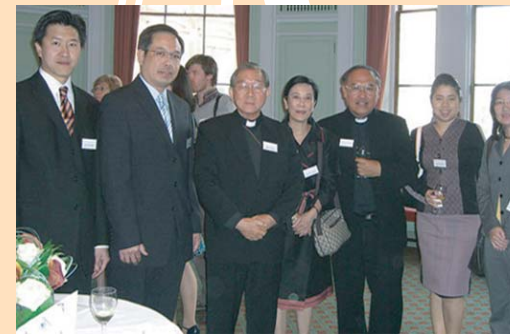
ครบรอบ 25 ปี พิทยาออฟฟานเจทรัสต์ ลอนดอน ท่ามกลางผู้ให้การสนับสนุน ท่านอาร์ชบิชอปแห่งเบอร์มิงแฮม คณะกรรมการกิตติมศักดิ์ ผู้บริหาร เจ้าหน้าที่จากสถานทูตไทยประจำประเทศอังกฤษ โดยท่านสังฆราชแห่งสังฆมณฑลจันทบุรี ประธานมูลนิธิสงเคราะห์เด็ก พิทยา เดินทางจากกรุงโรมเพื่อร่วมงานในครั้งนี้